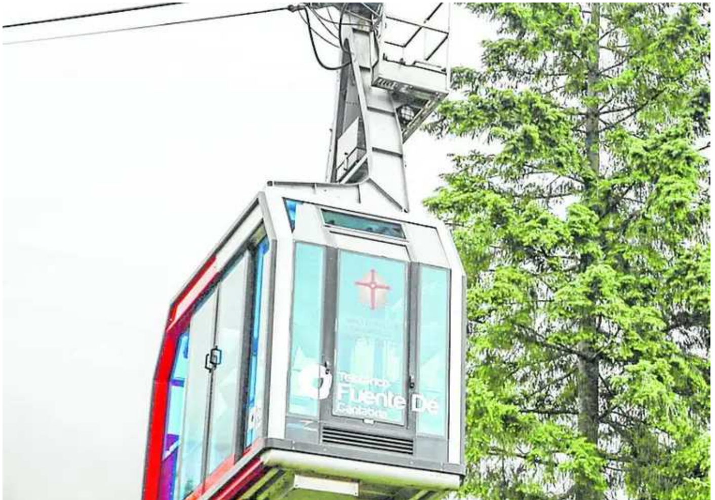
La cabina del teleférico de Fuente Dé, en la estación inferior.

Las carencias, que corresponden a 2022 y 2023, «no afectaron a la seguridad» y ya están corregidas. Tenían que ver con piezas obsoletas y falta de engrase